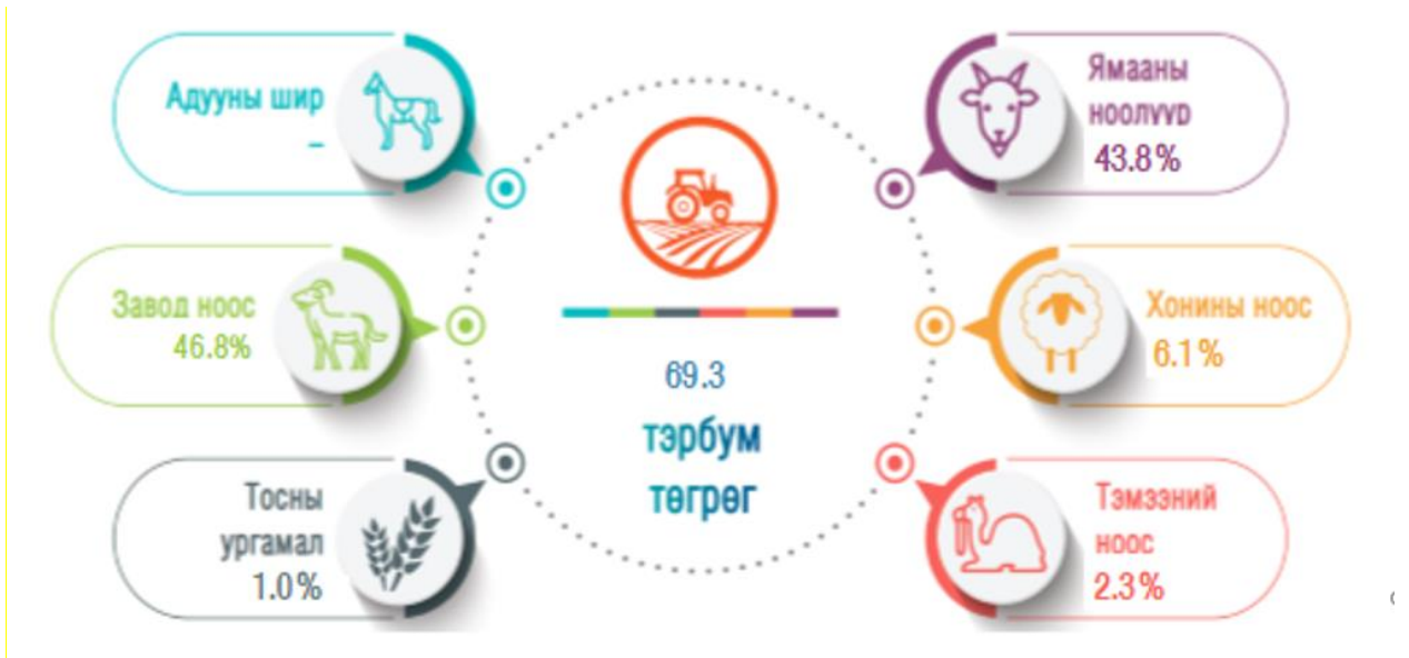
Зураг 1. Хөдөө аж ахуйн биржийн арилжаа