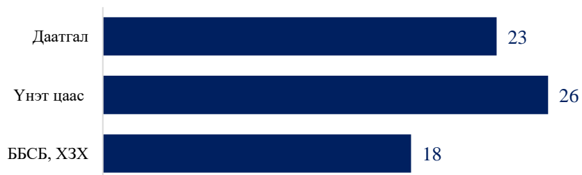
Дүрслэл 1. Өргөдөл шийдвэрлэх дундаж хугацаа (хоногоор)